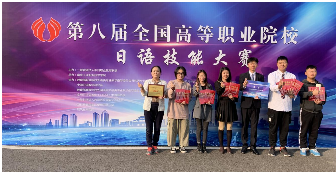
图3 第八届全国高等职业院校日语技能大赛颁奖现场